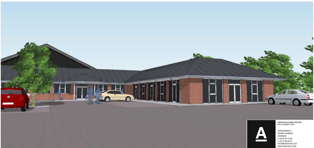
Figur 1 - Skitse af motionscenteret.