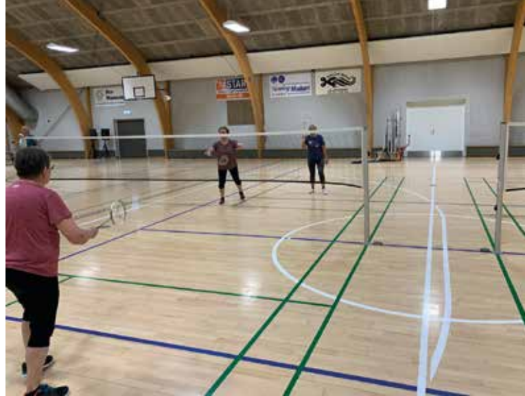
Nogle spiller badminton