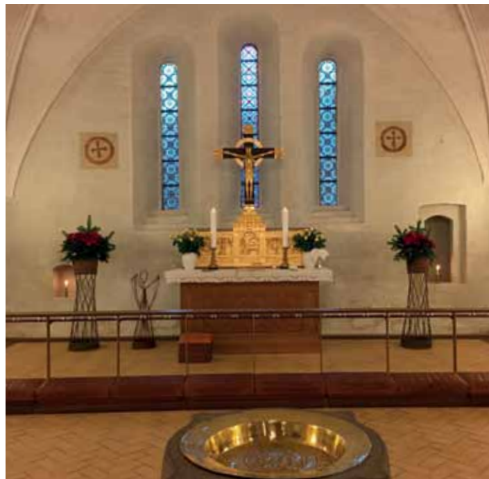
Alterpartiet i Rudkøbing Kirke.

Jeg vænnede mig til køreturen ad rute 8. Jeg overnattede nu på folde-ud-seng i et loftsrum i "Det gamle Hospital", når jeg skulle have konfirmander om morgenen!