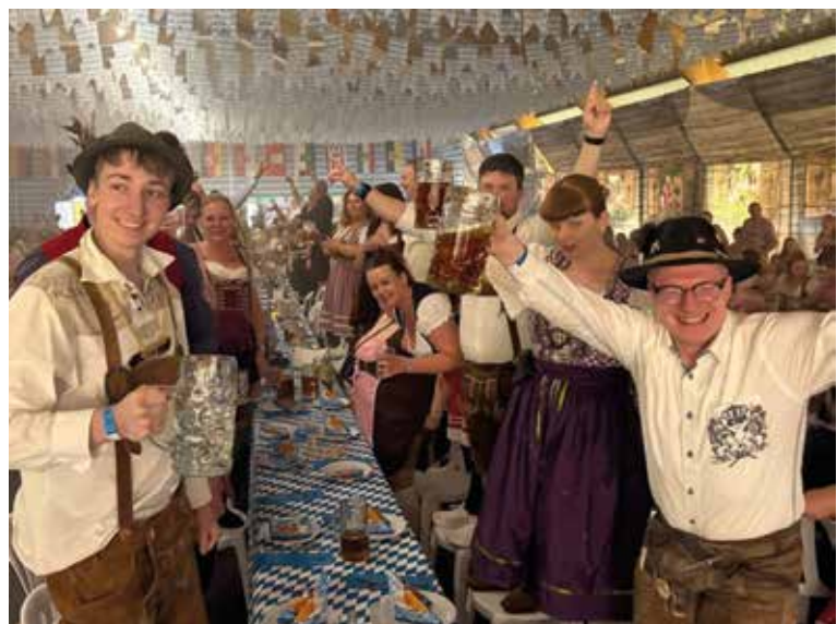
Billede fra et af bordene til årets bierfest 2026..