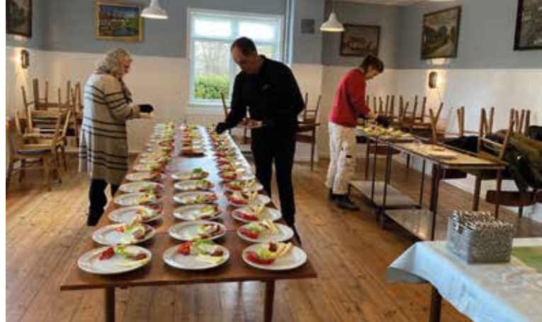
Klargøring af mad til arrangementet.