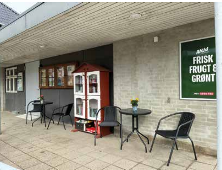
Borde og stole foran butikken.

Hver gang du handler lokalt, er du med til at bestemme, hvordan din by skal se ud i fremtiden. Din kvittering er ikke bare et bevis på et køb – den er en stemmeseddel for fællesskab, liv i gaderne og en by, der hænger sammen.