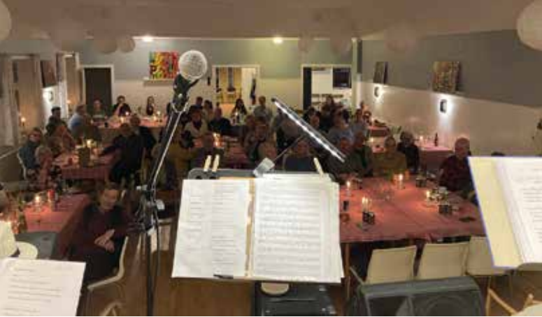
Salen set fra scenen til Sankt Patricks arrangementet.