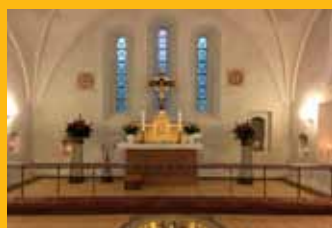
Fra en arbejdende pensionist