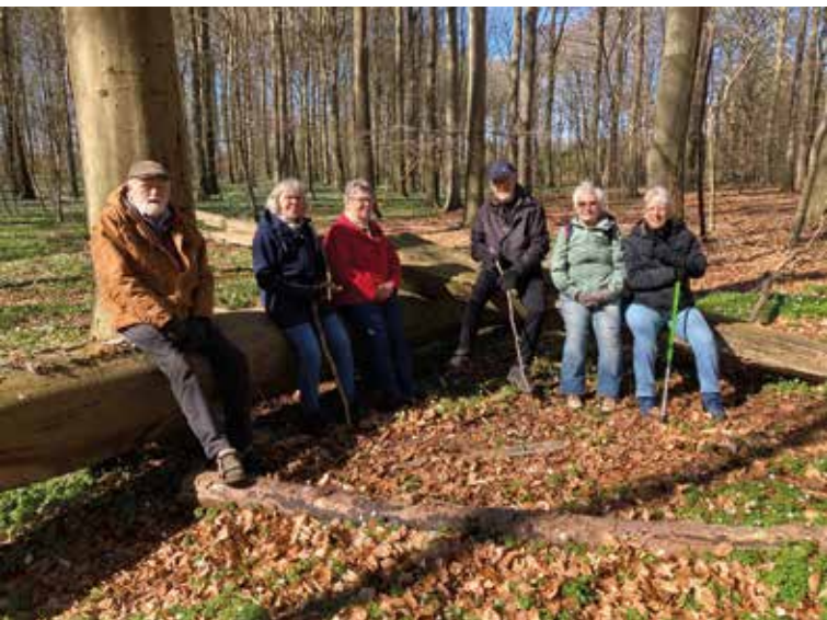
Naturtræningsholdet i Pipstorn Skov.

Seniorerne drosler ned med de indendørs aktiviteter i Bøgebjerghallen og Svømmehallen for denne sæson.