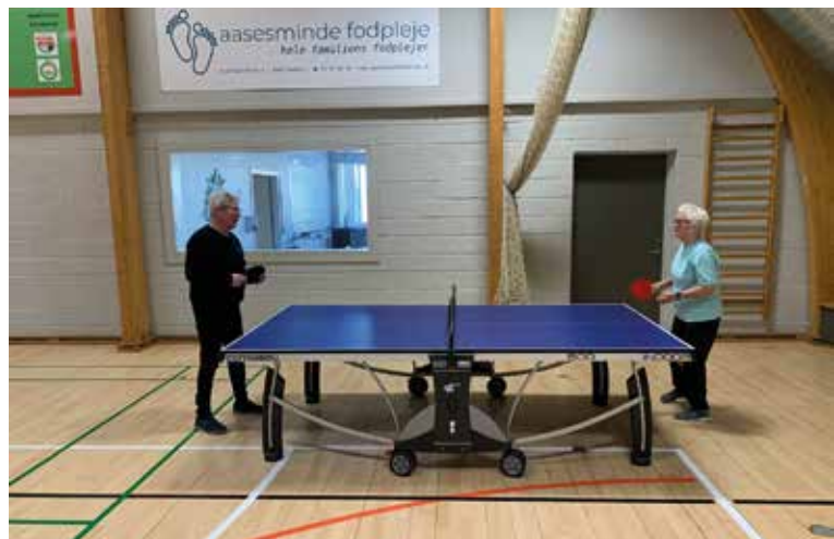
Mens andre spiller bordtennis